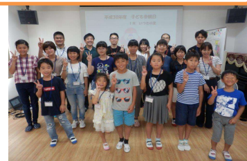
【2018 こども参観日 in いつきの里】