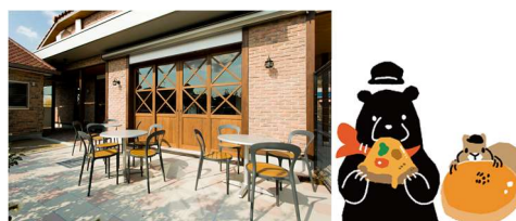
ラ・ルーチェ(2018.4～オープン)