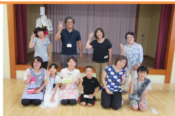
【2017 こども参観日 in 福角保育園・くるみ園】

「こども参観日」は、子どもたちに親の仕事をする姿やどんなことをしているのかを知って頂き、親の仕事への理解と家庭内のコミュニケーションの向上を図ります