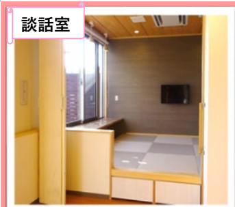
畳の小上がりスペースでゆったり