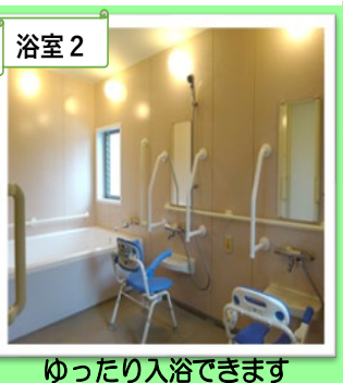
浴室2 ゆったり入浴できます