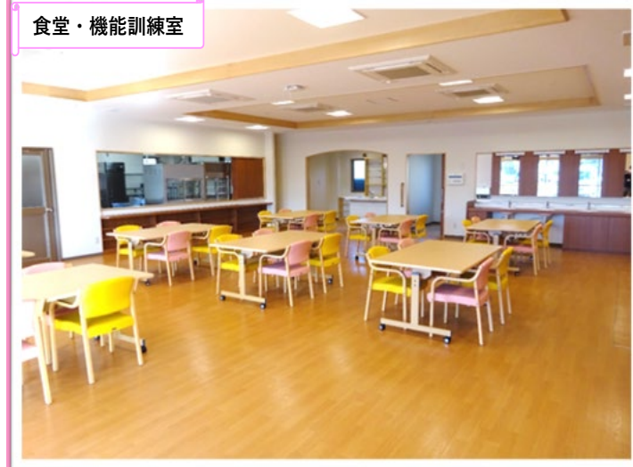
活動全般・リハビリおよび食事を行うスペースです