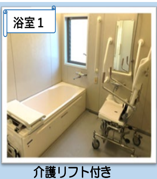
浴室1 介護リフト付き