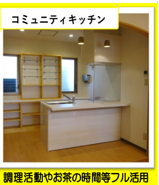
コミュニティキッチン