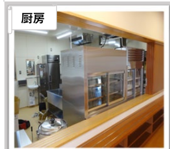
厨房を事業所内で調理します