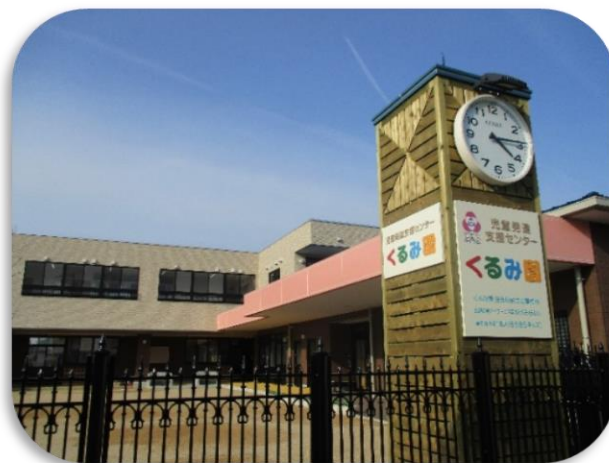
きらきらキッズは児童発達支援センター くらみ園の2階にあります

の共同運営により、それぞれの従業者の仕事と子育ての両立を図ることを目的に 2016年4月に開設されました 一時預かり事業（余裕活用型）は 2019年4月1日よりご利用いただけます 保護者の就労・通院・看護・リフレッシュなど 一時的に保育が必要な場合に お子さんをお預かりいたします