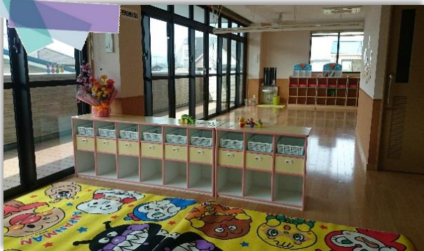
陽射しのふりそそぐ明るい保育室でみなさんをお待ちしています！