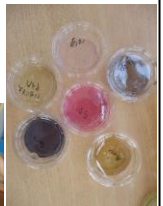
みてみて！！キレイでしょ♡

園の畑でとれたきゅうりを叩きキュウリにしました！友だちと力を合わせて叩き割り、給食の先生に楽しくしてもらってみんなでおいしくいただきました♡