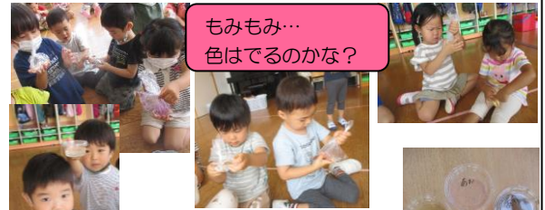
もみもみ…色はでるのかな？

花・葉っぱを使って色水をつくりました！袋に花を入れてモミモミ…なかなか色が出なくてくじけそうになりながらも、もみ続けていると少しずつ色が！「みてみてー！」と嬉しそうに言う子どもたちの表情は輝いていました！