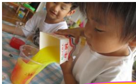
おっと！入れすぎたかな？