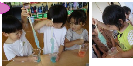
固まってきたよー！

花・葉っぱを使って色水をつくりました！袋に花を入れてモミモミ…なかなか色が出なくてくじけそうになりながらも、もみ続けていると少しずつ色が！「みてみてー！」と嬉しそうに言う子どもたちの表情は輝いていました！