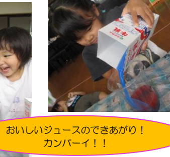
おいしいジュースのできあがり！カンパニー！！

色水遊びをしました。「色を混ぜるとどうなるのかな？」と言いながらコップに注ぎました。慎重な子はそーっと。大胆な子はドバーっと入れており、こぼれるのも楽しんでいました！できた色をみんなで見せ合いっこ！同じ色を使っているのに友だちと色が違うことに気付き、不思議を発見しました。最後は自分の作った色でスライムを作り、色水がだんだん固まっていくという変化も楽しんでいました！！