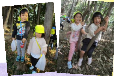
お山の木で木登りで～きた！