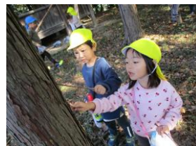
木の皮がなんかパリパリ…

「こうしてみたらいいんじゃない？」などと、面白さを感じている姿も少しずつ見られ始めました。引き続き、本番まで楽しみながら取り組んでいきたいと思います♪