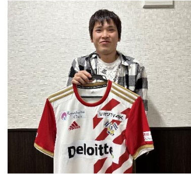
Wさん 趣味:サッカー

Wさんの趣味はサッカーです。実際にサッカーをする事はもちろん、日本代表の試合を観ることも好まれています。これからも休日にはサッカーを行い、友人と関係性を築いていきましょう。