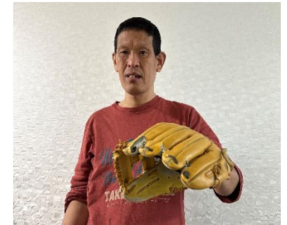
Hさん 趣味:スポーツ

Wさんの趣味はサッカーです。実際にサッカーをする事はもちろん、日本代表の試合を観ることも好まれています。これからも休日にはサッカーを行い、友人と関係性を築いていきましょう。