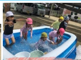
水の掛け合い競争 水鉄砲も大盛り上がり