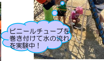
ビニールチューブを 巻き付けて水の流れ を実験中!