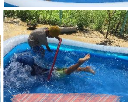
顔をつけてフラフープ くぐりに挑戦!!