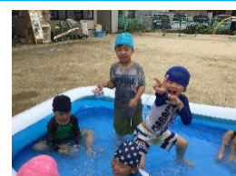
私は後ろ向きで くくれるよ~!!