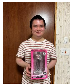
Iさん エヴァンゲリオン フィギュア