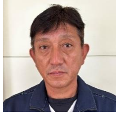
氏名: Nさん 作業班: 各種製品製造班

この度5月1日より臨時生活支援員として第2の人生を出発させて頂きました。福祉の仕事は長年経験していますが、今まで出来なかった事も多い様に思います。利用者一人一人の障害特性を十分に理解し、それに応じて適切な支援が出来るよう努めたいと思います。オールドルーキーではありますが、やる気は誰にも負けません。宜しくお願い致します。