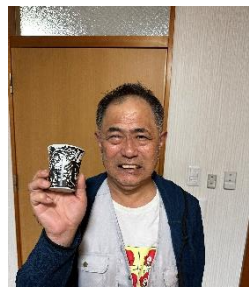
Yさん ワンピースのコッフ