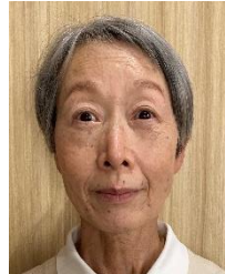
氏名: Tさん 作業班: 製菓製パン班

一年間ありがとうございました。皆様には日々お元気で健やかに過ごしてください。お世話になりました。