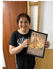
Iさん ワンピースの手配書