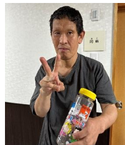
Hさん スヌーピーの水筒