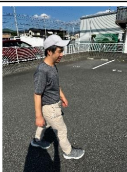
Sさん 趣味：ウォーキング

今回紹介するグループホームは「きぼうホーム」です。男性3名女性3名の方が利用されています。今回は皆さんの趣味を紹介します。