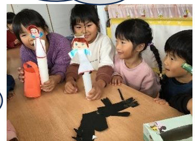
あかすきの絵本を見て、ペープサートを作りました😊