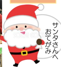
サンタさんへおてがみへ