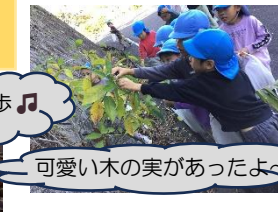
可愛い木の实があったよ〜