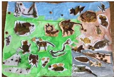
←「動物」をテーマに葉っぱの製作!次々に動物が出来上がっていきました。「みんなの動物を大きな紙に貼りたい!」というみんなの声ですてきなそう組動物園ができました😊