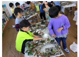
お散歩で見つけた木の实や草花で飾りつけをして、素敵なリースができました!