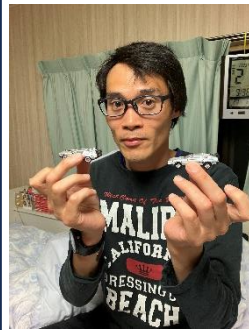
Uさん 趣味：映画鑑賞

Mさんの趣味は、野球観戦です。 愛勇会に所属されており、地元チームでもあるマンダリンパイレーツの応援を楽しんでいます。 今期も野球観戦に行き、大きな声で応援し、選手にエールを送っていきましょう。