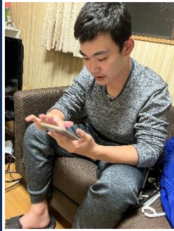
Nさん 趣味：スマホゲーム

今回ご紹介するグループホームはまりもホームです。男性6名の方が利用されています。皆さんの趣味について紹介します。