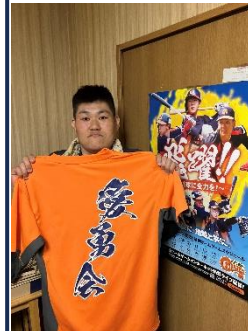
Mさん 趣味：野球観戦

Nさんの趣味は、スマホゲームです。 最近では栄冠ナインにハマっており、野球選手の育成や、OB選手の出現など、楽しみにしながらゲームをされています。 昔、テレビで活躍した選手が現れると懐かしみを感じるようです。