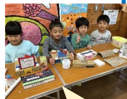
お客さんがエコバックを持ってお店にやってくると「いらっしやいませ。順番に並んでください」と案内が入っていました♪