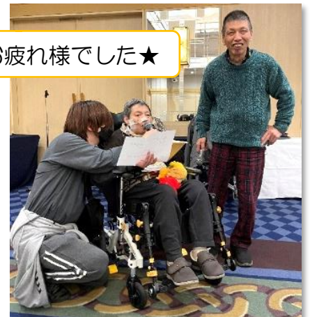
今年もお疲れ様でした★