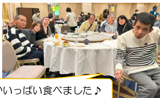
おなかいっぱい食べました♪