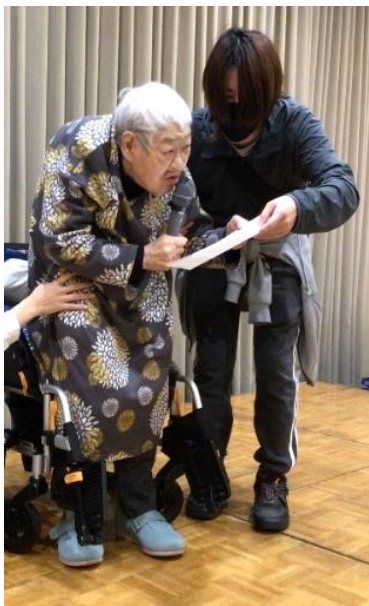
忘年会を始めます！

12月13日、ホテルマイステイズ松山で忘年会を行いました。MORE 開所以来、初めて外部での開催となり、利用者さんもドキドキ・わくわく、楽しみにされている様子でした。利用者さんの挨拶・乾杯で忘年会が始まりました。余興や今年を振り返るスライドショーを観ながら、お食事とお酒やソフトドリンクを楽しんでいただきました。海老のフリットや牛肉とじゃがいものガーリックソテー、白身魚の中華甘酢餡かけ、バナナシフォンケーキなど豪華なコース料理に、利用者さんも職員も大満足でした。最後も利用者さんの挨拶で忘年会を締めくくっていただきました。帰りの送迎車の中で「楽しかった！来年もしたい！」という意見をいただいたので、来年も利用者さんに喜んでいただける忘年会にしていきたいと思います。