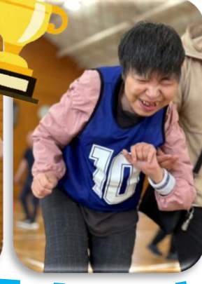
遠くを 目指して☆彡