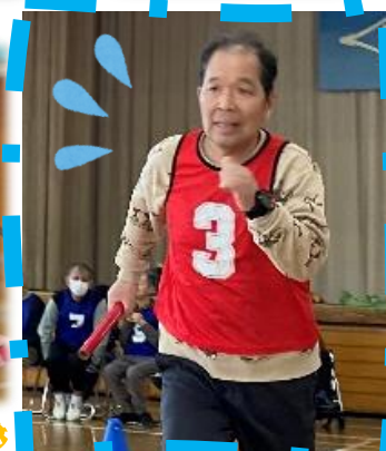
みんなでバトンを繋ぎました！