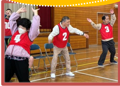
しっかりと準備運動！

5月6日（水）に堀江小学校体育館でMORE運動会を開催しました。お手玉遠投ゲーム、3メートルコーンリレー、10メートルリレーの3種目で競いました。今年度はタイム測定なども行いました。これからの健康活動に役立てていきたいと思ひます！！